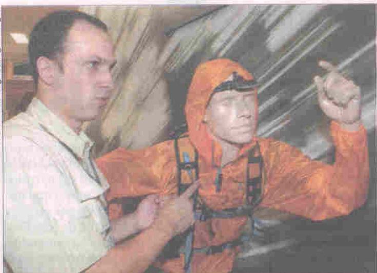
Jaqueta da Kailash pesa 87 gramas, segundo Alexandre Barbone

dústria dos esportes ao ar livre vem crescendo nos últimos sete anos em razão da adesão de atletas ocasionais e principiantes. Estima-se que 80% das vendas são destinadas a esse público, enquanto que apenas 20% são para profissionais.